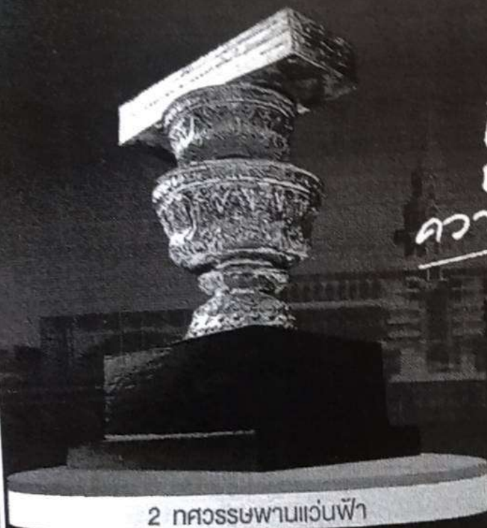
2 ถ้วยรางวัลพานแว่นฟ้า